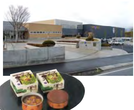
▲北信濃の山々を展望する新本社工場