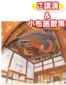
▲葛飾北斎の天井絵(岩松院にて見学予定)