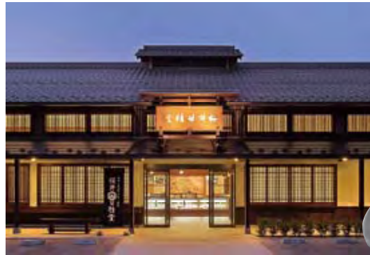
▲200年の老舗の風格の小布施の店舗