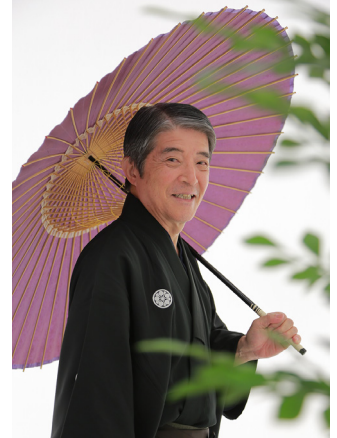
本格スタジオでのお写真